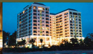
Kantary Bay, Rayong