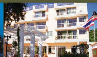
Kantary Bay Hotel, Phuket