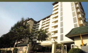
Kantary House, Bangkok

A part of the Kantary Hotel & Serviced Apartment Group