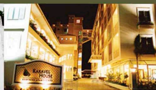
Karavel House, Sriracha