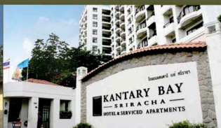
Kantary Bay, Sriracha